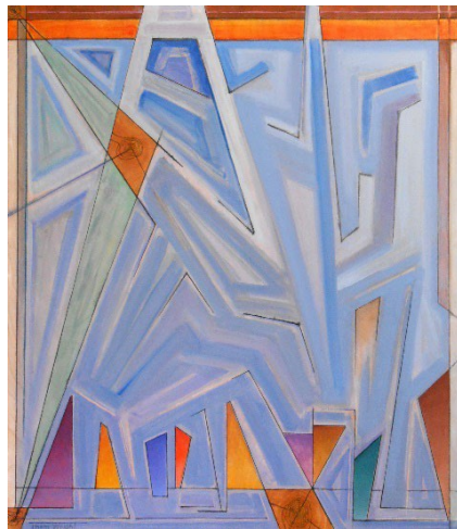
In Balance with Nature #55 , Thomas Wright, Sơn Acrylic và Mực trên Vải, 2022

Những tranh vẽ hình học đầy màu sắc của họa sĩ Thomas Wright ở Huntington Beach nói lên sự biến đổi khí hậu xuyên qua những thành phần tượng trưng chú tâm vào việc tìm kiếm sự quân bình giữa nhu cầu của thế giới thiên nhiên và ước vọng của nhân loại.